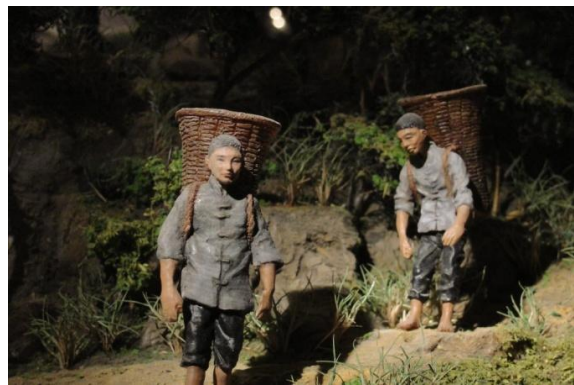
2 將薄木片背至腦寮