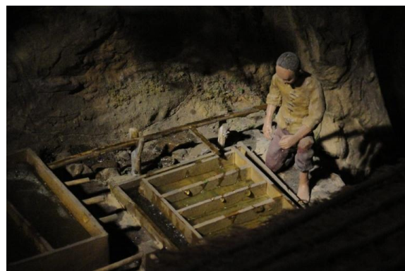
4 冷卻結晶出樟腦砂