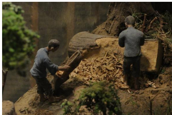
1 以手斧將樟木刨成薄木片