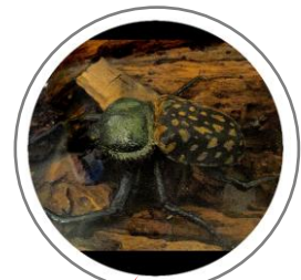
長臂金龜 (你必須先找到抽屜，並拉開它)