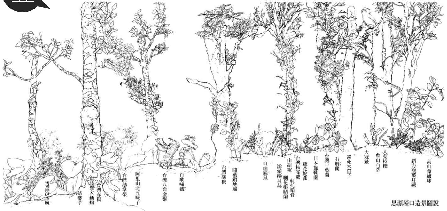
思源埡口造景圖說