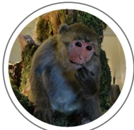
台灣獼猴 (有兩隻喔！)

◆樹木枯倒死亡後，並不是就此了無生趣；相反的，它仍是許多動、植物生活嬉戲的樂園。在展廳現場的帶根枯倒木上，你找得到牠們嗎？請把有找到的打勾。