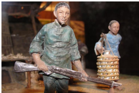
6 武裝戒護運送下山

請你參考「模型櫃」的造景，依照「伐樟製腦」工作的先後順序，填入適當號碼（1、2、3……）。